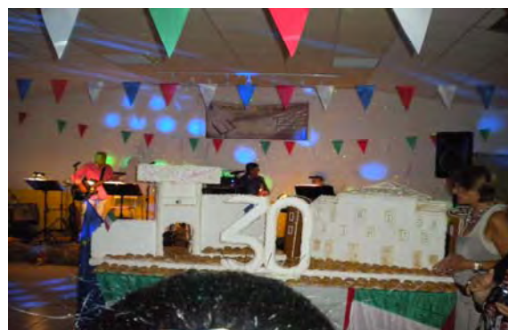
Magnifique et délicieux gâteau anniversaire confectionné par les « Moulins du Montagnier », représentant un château, symbole de Terdobbiate.