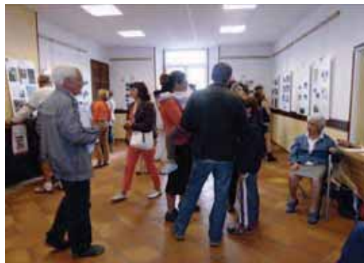
Salle communale du Vieux-Village le 15 septembre 2013

Cette année le thème des JOURNÉES EUROPÉENNES DU PATRIMOINE : « Cent ans de protection du patrimoine » a permis à Saint-Julien de faire le point et de dresser l'inventaire des réalisations, des rénovations, des mises en valeur initiées depuis des années. Le travail élaboré autour du sauvetage de nos archives et les diverses monographies relatant le passé de notre commune devaient servir de point d'ancrage d'autant que notre association vient d'en assurer l'édition.