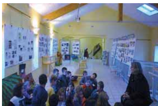
Visite d'une classe de l'école primaire

Plusieurs classes de primaire, les enfants du centre aéré et un groupe de personnes âgées de la résidence Verdon-Accueil ont pu bénéficier de visites guidées.