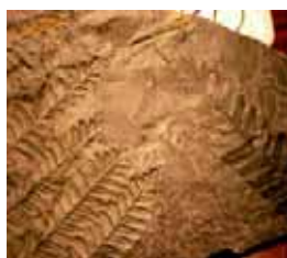
Fougères Grand Blé