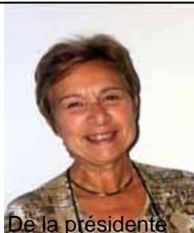
De la présidente

Patrimoine du Haut-Var/Verdon Répertorier, aider à entretenir, valoriser, faire connaître le patrimoine de la commune de St-Julien le Montagnier