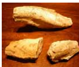
Petit poisson cassé en trois