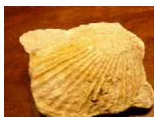
Coquille Saint Jacques