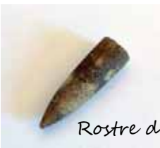
Rostre de belemnite