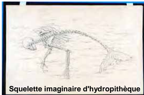
Squelette imaginaire d'hydroptère

Au musée Gassendi de Digne-les-Bains, 64 boulevard Gassendi, téléphone 04 92 31 45 29, vous pourrez retrouver le dialogue, évoqué ici entre l'art et la science, car vous y verrez à la fois un muséum d'histoire naturelle et un musée des Beaux-arts aussi riches que passionnants.