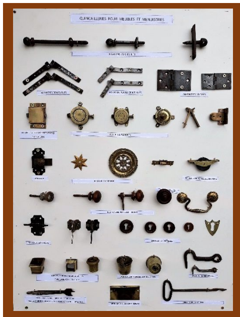
Quincaillerie, montée en panneau par J.-M. Yver