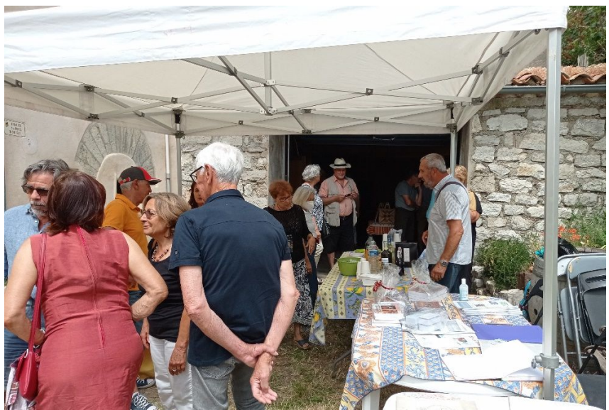
Pour ne pas perdre la tradition : apéro à midi !