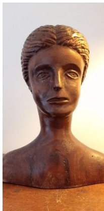
Sculpture de François Néri

La finition : gouges à bretter, racloirs, rifloirs . Une fois la sculpture achevée, elle doit toujours être protégée à l'aide de produits de finition ( vernis, cire, huile, ... ).