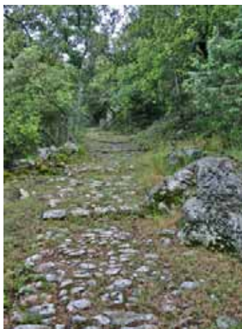
Caladage avec cale-roues