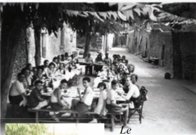
Le traditionnel aïoli de la Place Neuve est devenu la paella pour 92 convives cette année.