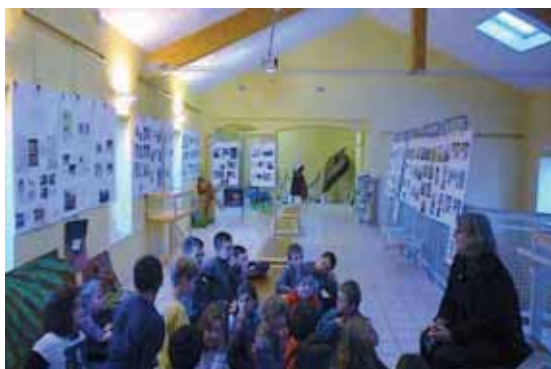
Visite d'une classe de l'école primaire

Plusieurs classes de primaire, les enfants du centre aéré et un groupe de personnes âgées de la résidence Verdon-Accueil ont pu bénéficier de visites guidées.