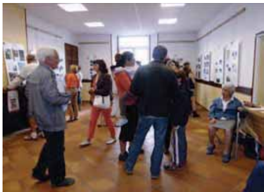
Salle communale du Vieux-Village le 15 septembre 2013

Cette année le thème des JOURNÉES EUROPÉENNES DU PATRIMOINE : « Cent ans de protection du patrimoine » a permis à Saint-Julien de faire le point et de dresser l'inventaire des réalisations, des rénovations, des mises en valeur initiées depuis des années. Le travail élaboré autour du sauvetage de nos archives et les diverses monographies relatant le passé de notre commune devaient servir de point d'ancrage d'autant que notre association vient d'en assurer l'édition.