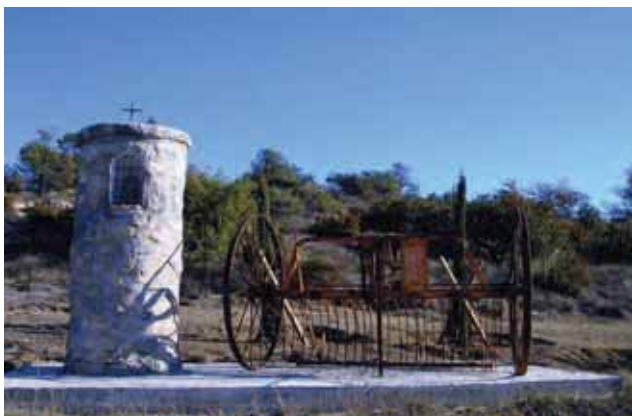
L'oratoire Saint-Éloi de Saint-Pierre reconstitué

Il en a été recensés 4 dont un entièrement disparu au lieu dit « les remises ». Par contre celui de Saint-Pierre qui avait été démonté est aujourd'hui reconstitué au carrefour à l'angle de la route de Gréoux et de la traverse Saint-Éloi.