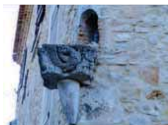
Niche d'angle à Ginasservis

L'oratoire peut aussi désigner une chapelle privée adjointe à une grande maison (palais, château ou hôtel) ou une chapelle publique élevée sur le bord d'une route pour conserver un souvenir religieux ou prier ses morts qu'on enterrait alors souvent au voisinage des carrefours.