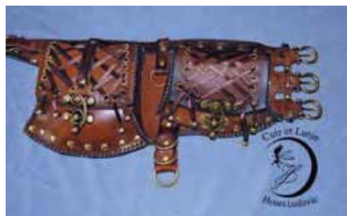
Un travail d'une qualité exceptionnelle

Aujourd'hui, il nous propose la fabrication d'objets personnalisés : sacs, ceintures, étuis de fusil gravés, cartouchières, chapeaux, pochettes et tous articles en cuir, mais aussi création et réalisation de vêtements de mariage ou de cérémonie en tissus, pour hommes ou pour femmes, et bien sûr, ses célèbres lutins ! N'oublions pas que c'est également un animateur qui a exercé ses talents au centre aéré cet été, et qui sera à même d'assurer l'animation de fêtes privées tels que les anniversaires pour enfants. Enfin, en liaison avec son premier métier, notre homme est aussi un décorateur d'intérieur de talent.