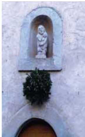
Statue moderne remplaçant celle volée