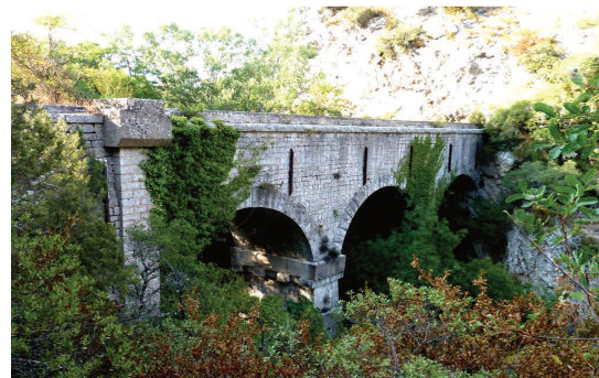
Le Grand Pont aqueduc Malavalasse

Le travail de recherche a déjà commencé, rendez-vous est pris pour le canal de Provence, des articles sur internet proposés ainsi que de vieilles photos.