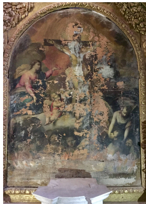
L'état inquiétant des tableaux de l'église.

Cette réunion a permis de mettre en place un planning des tâches pour l'avancement du dossier. Il en ressort que la signature de la convention avec la Fondation Patrimoine se fera dans le deuxième semestre 2020 et que les travaux sur le bâtiment ne commenceront qu'en 2021. Sauf si la commune décide de s'occuper du drain en urgence. La restauration d'éléments du mobilier suit une autre procédure et peut avancer en parallèle.