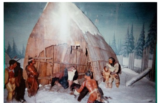
Musée de la civilisation Québec

À partir du XVI e siècle, l'arrivée des colons européens bouleverse tout. Ils sont chassés de leurs terres, massacrés et plus encore décimés par des épidémies et le travail forcé. Encore plus grave pour la suite, ils perdent les conditions nécessaires à leur survie économique basée sur une exploitation raisonnée de la nature : la cueillette, la chasse) et l'absence de propriété terrienne. Leur organisation sociale détruite et la christianisation forcée leur font perdre une grande partie de leur culture.