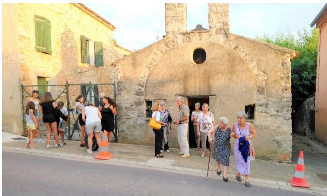
Sortie de messe le 20 août 2019